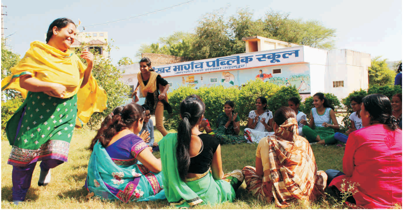
“घोड़ा है चमार भाई...” का खेल में धमाल-मस्ती।