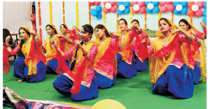
दीवाली समारोह के दी गई कुछ प्रस्तुतियाँ