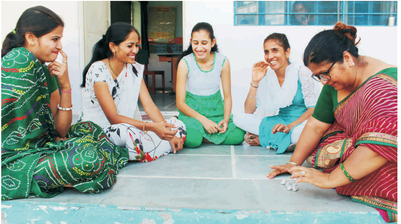
तारा परिवार के सदस्य गुट्टे खेल का आनन्द उठाते हुए।